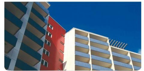
Komplett möbliert mit Balkon