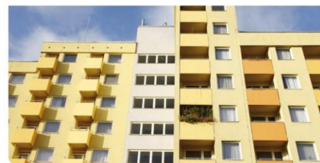
Jedes Apartment hat einen Balkon.