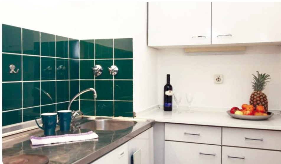
Zweckmäßig und komplett möbliert.

Ein-Zimmer-Apartments im Apartmenthaus Kulbeweg 30 in Berlin-Spandau