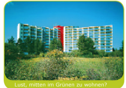
Lust, mitten im Grünen zu wohnen?