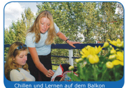
Chillen und Lernen auf dem Balkon