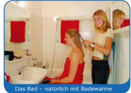
Das Bad – natürlich mit Badewanne