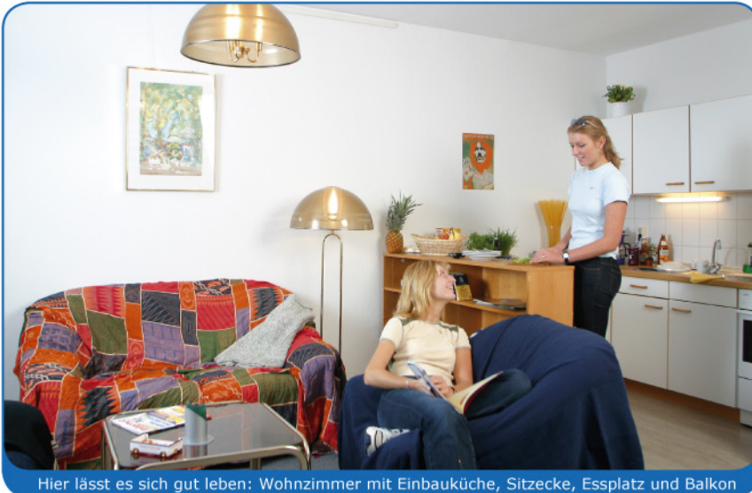
Hier lässt es sich gut leben: Wohnzimmer mit Einbauküche, Sitzecke, Essplatz und Balkon

Nur für WGs: Drei-Zimmer-Apartments im Apartmenthaus Rhinstr. 51 – 77, Berlin-Lichtenberg