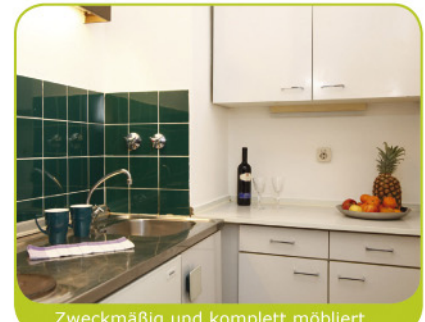
Zweckmäßig und komplett möbliert