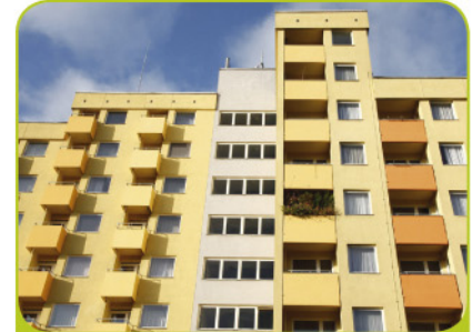
Jedes Apartment hat einen Balkon