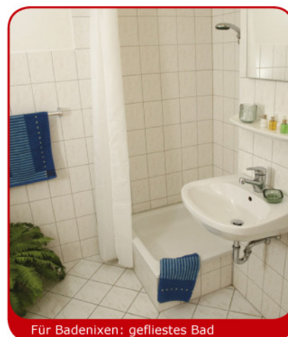
Für Badenixen: gefliestes Bad