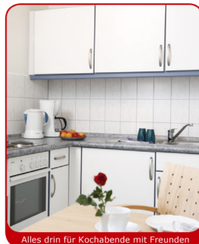
Alles drin für Kochabende mit Freunden